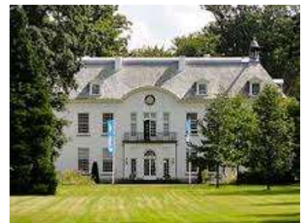
Landgoed Oud Bussum

In 1570 schonken de besturen van Naarden en de Gooise dorpen het landgoed Oud Bussem aan Paulus van Loo, de Baljuw van Gooiland . Op het landgoed lag een boerderij, die in 1672 bij het beleg van Naarden door de Fransen verbrand werd en in de 18e eeuw herbouwd werd door Michiel Hinloopen. In 1974 brandde de boerderij opnieuw af. In de 18e eeuw werd op het landgoed tevens een landhuis gebouwd door Abraham Scherenberg. Dat werd in 1929 afgebroken en herbouwd door Pieter van Leeuwen Boomkamp. Architect was D.F. Slothouwer. In 2010 werd aan de achterzijde van het landhuis een Orangerie aangebouwd.