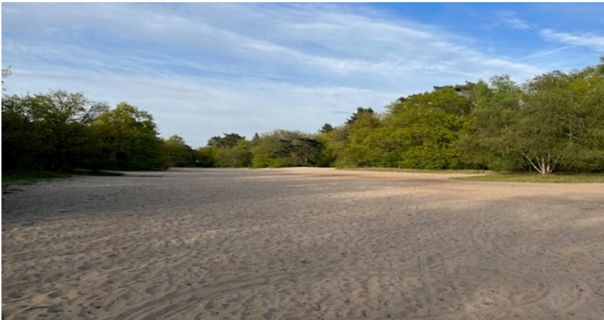
Natuurgebied Mauve met zandverstuiving

Via natuurgebied Mauve met een grote zandverstuiving lopen alle wandelaars naar de finish in Laren.