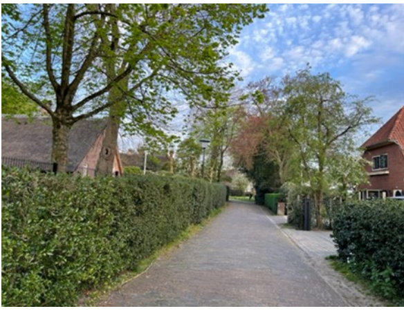
Het oude dorp Blaricum