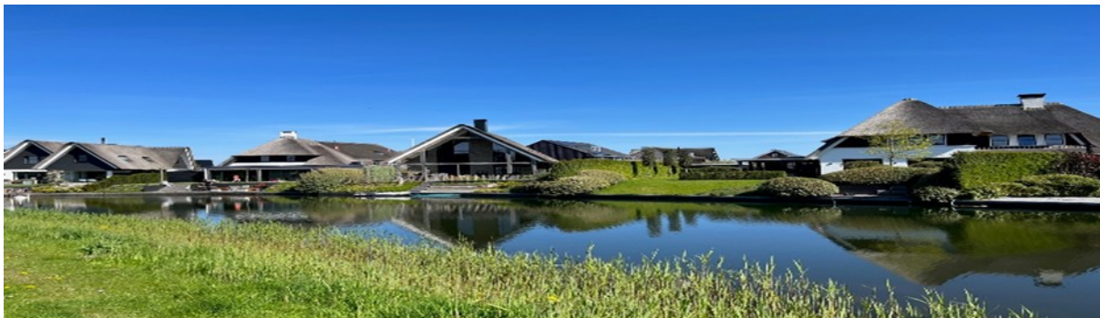
De nieuw bouwwijk Blaricummer Meent, waar de 30 en 40 km door heen wandelen met de fraaie huizen en de slingerende Meentstroom.

De 30 km loopt een groene route door de woonwijk Bijvanck naar de Blaricummer Meent en slingert 3 kilometer langs de rivier de Meentstroom . De 40 km loopt een in 2023 geheel vernieuwde route onder de Stichtse brug door naar de Blaricummer Meent en sluit bij restaurant Bruis aan bij de 30 km. Daarna lopen deze twee routes gezamenlijk langs het Gooimeer en door winkelcentrum Oostermeent en het stadspark van Huizen en sluit bij het natuurgebied de Woensberg weer aan bij de 20 km. Via de Blaricummer Eng wordt weer de kantine van de handbalvereniging SDS'99 bereikt.