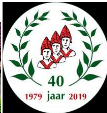
40 jaar Historische Kring Eemnes