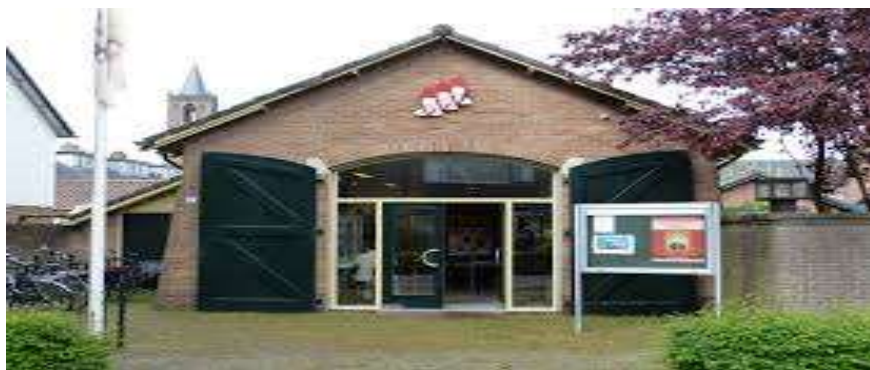
Historische Kring Eemnes, Raadhuislaan 2-A