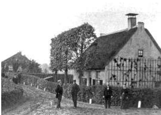
Blaricum van toen en nu , links 2 e Molenweg van toen, rechts van nu

Wie het oude dorp van Blaricum inrijdt, ziet direct de boerderijen met de rieten daken. Een aantal van deze boerderijen is van bekende kunstenaars en idealisten geweest. Blaricum kent een grote hoeveelheid architectonische waardevolle panden gebouwd door bekende architecten. Kenmerkend voor het oude dorp zijn ook de kronkelweggetjes, de arbeiderswoningen en de prachtige groene hagen. Ook de akkers met rogge en boekweit bieden een fraaie aanblik. Centraal in het oude dorp staan de muziektent en de erfgooiersboom, een bijzondere herinnering aan het erfgooiers verleden van de gemeente.