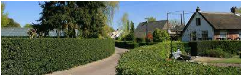
Het oude dorp van Blaricum

Maar de 30 en 40 km wandelaars maken eerst een uitstap naar het prachtige natuurgebied 't Harde en het Warandepark (de Blaricummer eng).