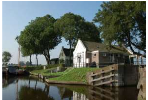
het sluisje van Eemnes in de polder

waar nu Eembrugge ligt, het dorp Ter Eem, versterkt met een kasteel. Kort daarna begonnen pioniers, die Ter Eem bewoonden, het moerasgebied ten westen van de Eem te ontginnen, vanuit een landtong in de rivierbocht van de Eem tegenover Ter Eem. Daaruit kan de naam van onze gemeente verklaard worden. "Nes" betekent namelijk landtong aan de binnenbocht van een rivier. Een kreek op de plaats van de huidige Gooiergracht was de onofficiële grens tussen het Graafschap Holland en het bisdom Utrecht. In de 14e eeuw kreeg de Graaf van Holland ook belangstelling voor het nieuwe land. Rond 1325 liet hij met palen een grens markeren op de plaats waar nu de Meentweg en de Wakkerendijk lopen. Deze grens werd 'de rede' genoemd en het Eemnesser gebied ten westen van de rede noemde de Graaf Oost-Holland.