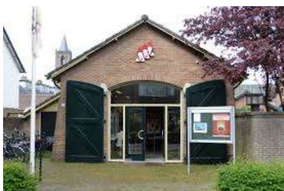
Historische Kring Eemnes, Raadhuislaan 2-A