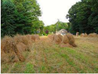
De Larense engen

Zo kunnen de akkers in Laren worden omschreven. Sinds 1994 zet de Stichting Oude Landbouwgewassen Laren (S.O.L.L.) zich in om de restanten van de oorspronkelijke engen weer te gebruiken waarvoor ze vroeger bedoeld waren. Op dit moment heeft de stichting 14 akkers (engrestanten) in beheer met een totale oppervlakte van 7000 vierkante meter.