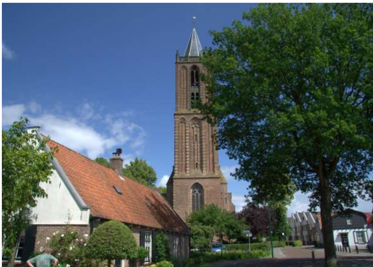
De toren van de grote kerk