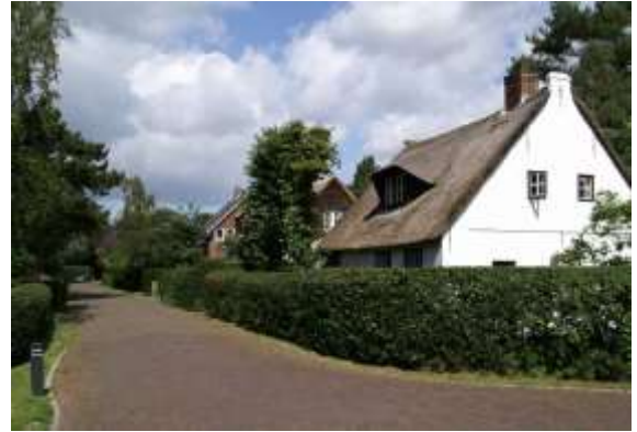
2 de Molenweg nu