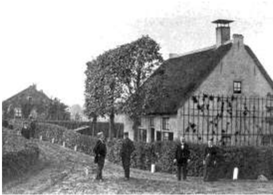
2 de Molenweg toen