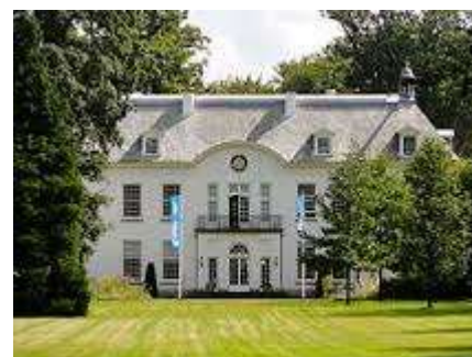
Landgoed Oud Bussum

In 1570 schonken de besturen van Naarden en de Gooise dorpen het landgoed Oud Bussem aan Paulus van Loo, de Baljuw van Gooiland . Op het landgoed lag een boerderij, die in 1672 bij het beleg van Naarden door de Fransen verbrand werd en in de 18e eeuw herbouwd werd door Michiel Hinloopen. In 1974 brandde de boerderij opnieuw af. In de 18e eeuw werd op het landgoed tevens een landhuis gebouwd door Abraham Scherenberg. Dat werd in 1929 afgebroken en herbouwd door Pieter van Leeuwen Boomkamp. Architect was D.F. Slothouwer. In 2010 werd aan de achterzijde van het landhuis een Orangerie aangebouwd.