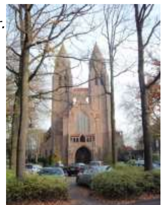
Sint Jan Basiliek >