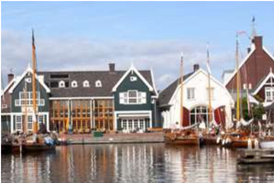
Haven van Huizen

vissersdorp Huizen is schilderachtig Gooimeer, vroeger de Zuiderzee. In de waar de vissers tot in de jaren dertig aanmeerden, kunt u nu uitstekend verschillende restaurants. Over de Huizen komt u meer te weten in het