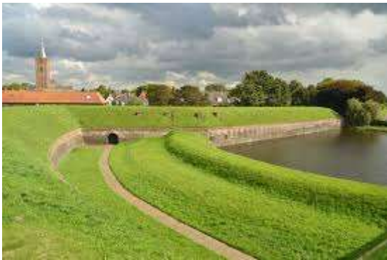
de Naarder Vesting

Naarden is een van de best bewaarde vestingsteden in Europa en vooral beroemd om zijn unieke stervorm. De vesting heeft zes bastions, een dubbele omwalling en dubbele grachtengordel. Er is goed te wandelen over de verdedigingswerken. Ook een rondvaart rond de werken is mogelijk. De omvangrijke, uitstekend gerestaureerde vesting, waarvan de meeste delen uit de 17e eeuw over zijn, is voor het grootste deel vrij toegankelijk.